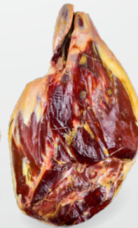
Geschält und poliert