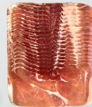
In Scheiben geschnitten